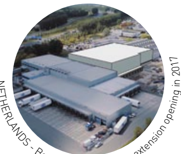
NETHERLANDS - Bodegraven - New site extension opening in 2017