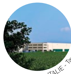
ITALIE - Tavazzano

Portugal — Les activités de groupage, de logistique des produits frais et de la restauration hors domicile se développent et tirent la croissance. Le groupe a complété son dispositif immobilier en conséquence : ouverture d'une plate-forme Transport à Coïmbra et extension du site de Porto pour le groupage; agrandissement du site d'Alverca pour répondre aux besoins d'un nouveau client européen spécialisé dans les produits laitiers. STEF a également prévu d'étendre ses capacités de stockage sur le segment du surgelé à Lisbonne en 2017 pour faire face à la demande du marché.